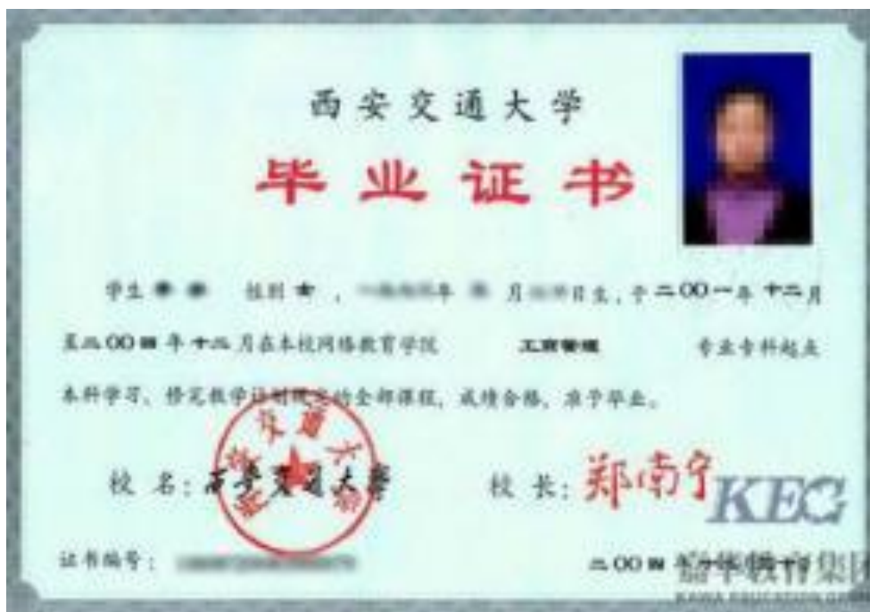
教育部学历证书电子注册备案表

2. 境内高校往届毕业生须上传毕业证书照片。证书丢失的可提供“中国高等教育学生信息网”的《教育部学历证书电子注册备案表》或《中国高等教育学历认证报告》。